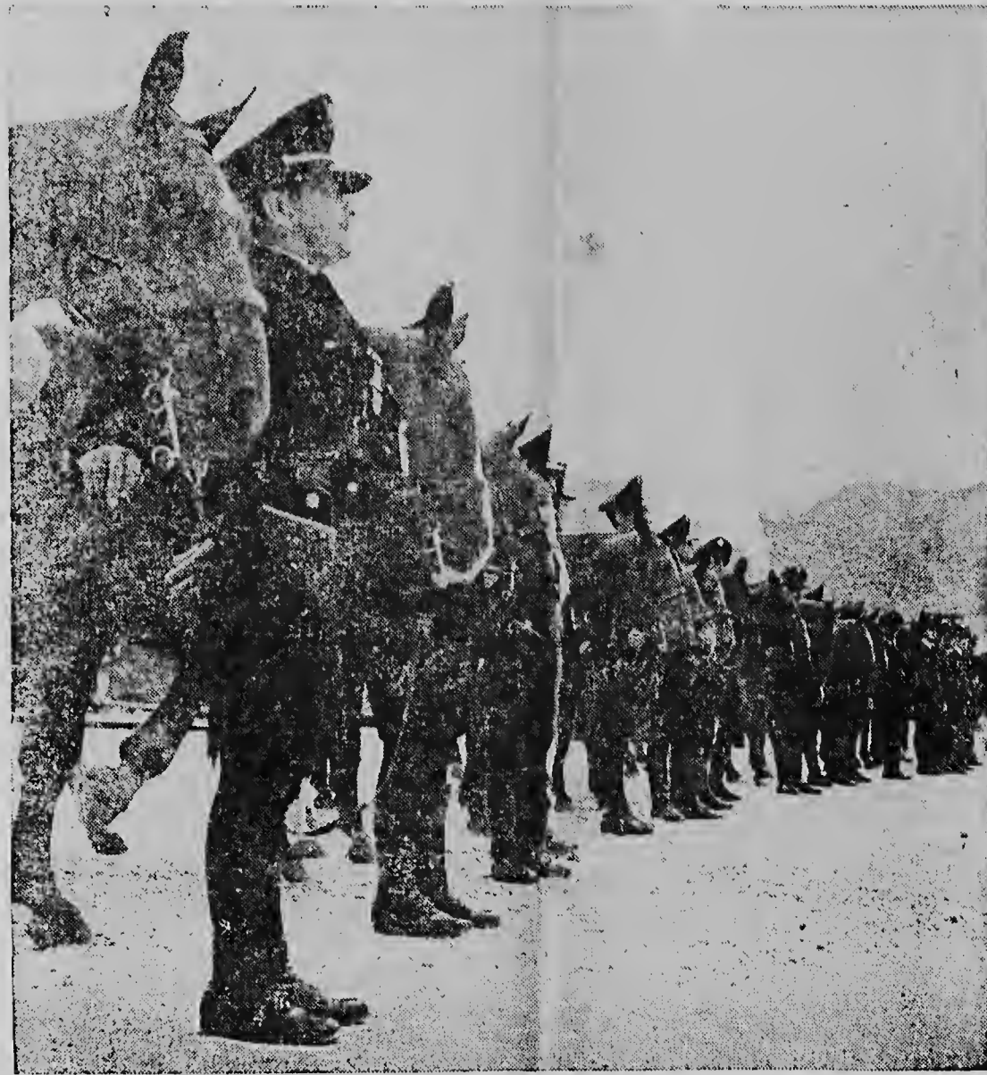
VENEZUELA heeft thans een afdeling bereiden politie. Bovenstaande foto werd gemaakt tijdens de eerste inspectie door de Commandant van de politie. De bereiden troepen zullen worden gebruikt om de orde in de meer afgelegen binnenlanden te handhaven.

Te San Francisco werd deze opvatting cuigermate gewijzigd en werd grotere vrijheid aan de Algemene Vergadering gegeven. Nochtans bleef het veto in de Veiligheidsraad gehandhaafd en mocht de Algemene Assemblée slechts „aanbevelingen“ doen. Inderdaad sluit de stemming-procedure in de Assemblée, met één stem per land de mogelijkheid uit, dat haar besluiten meer gewicht hebben dan van raadgevende aard. Nu zien wij de tekortkoming van een organisatie, welke doelmatige werking afhankelijk van het samenwerking met een land, die beheerst wordt door een internationale partij, die